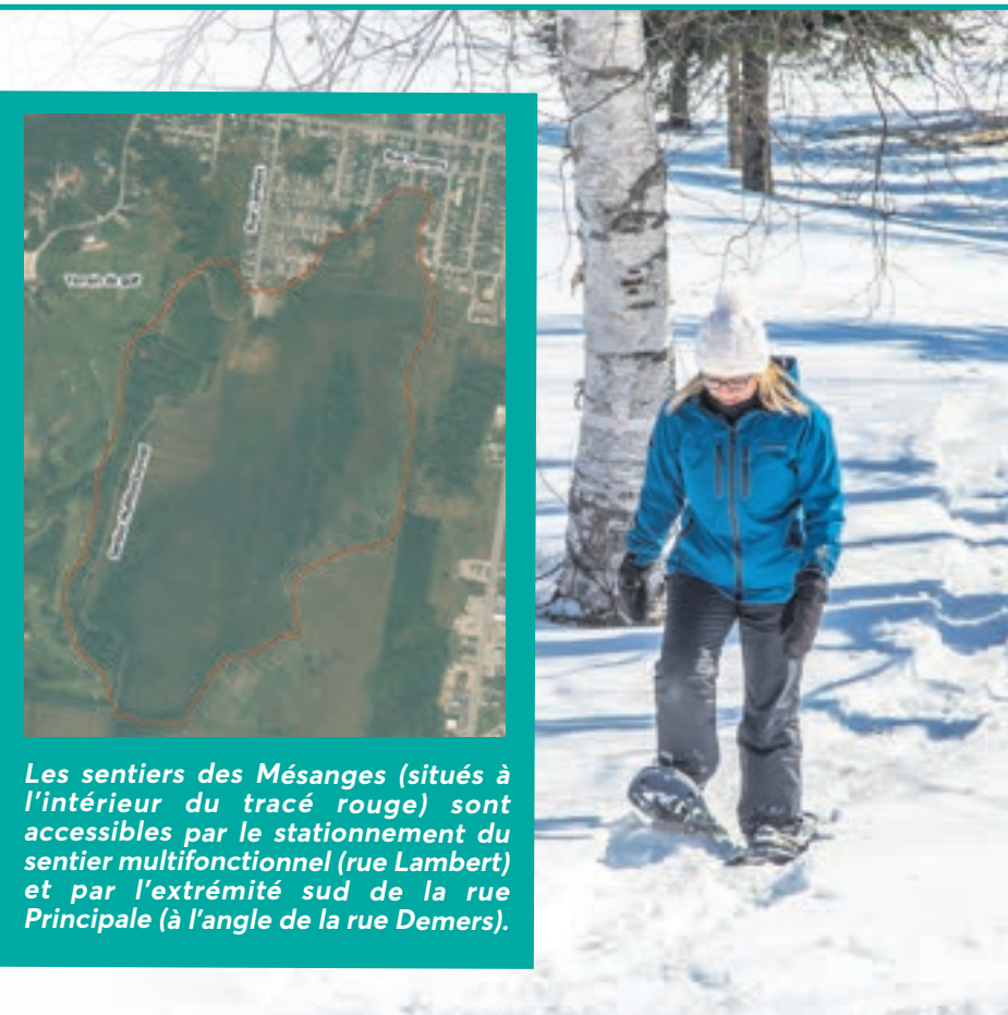
Les sentiers des Mésanges (situés à l'intérieur du tracé rouge) sont accessibles par le stationnement du sentier multifonctionnel (rue Lambert) et par l'extrémité sud de la rue Principale (à l'angle de la rue Demers).

Habillez-vous chaudement, préparez-vous à boire et à grignoter, puis allez à la découverte de ces sentiers! Ils n'attendent que vous!